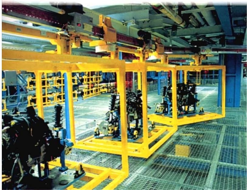
Die Elektrohängebahn ist eines von vielen Anwendungsfeldern für den berührungslosen CAN-Bus

Berührungsloser CAN-Bus sorgt für verschleißfreien Kontakt zu mitfahrender Elektronik